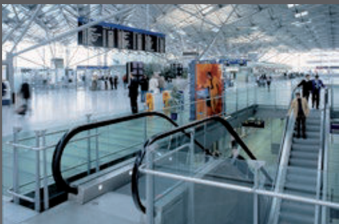
Escaso desgaste en zonas públicas