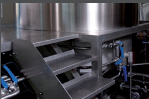
Antideslizante en aplicaciones industriales