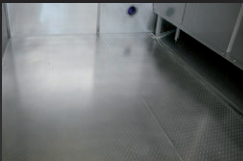
Suelos de cámaras frigoríficas en la gastronomía