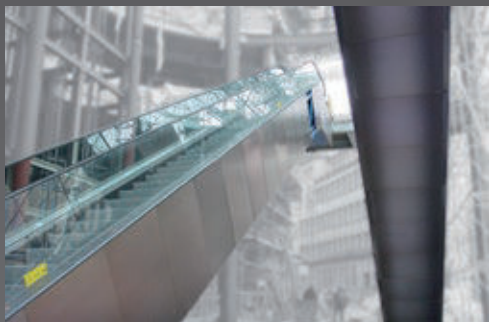
Uso decorativo en el diseño