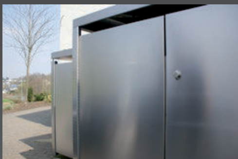
Diseño libre de objetos