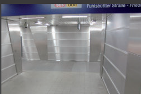
Antivandálico en espacios abiertos al público